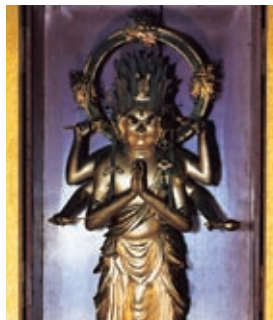
馬頭観世音菩薩立像

本尊の馬頭観世音菩薩は、白馬を頭に載せているところから馬頭観音とよばれています。三面六臂の木彫金箔立像で、平安時代の作と伝えられています。