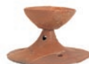
高杯・駒形大塚古墳出土