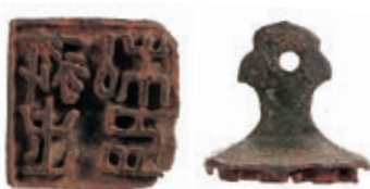
那須官衙遺跡から出土された銅印