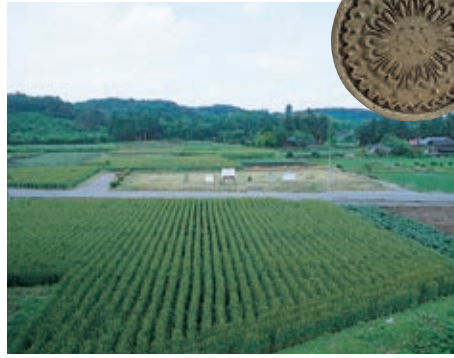
那須官衙遺跡/銚瓦

農具や生活用品など、この地に伝わる民俗資料を数多く展示した資料館で、当時の暮らしを垣間見ることができます。