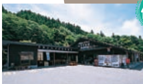
御前岩物産センター