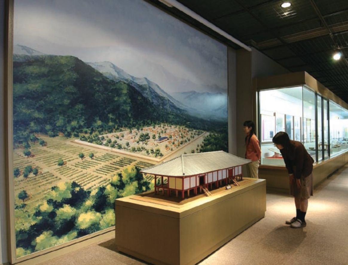
なす風土記の丘資料館