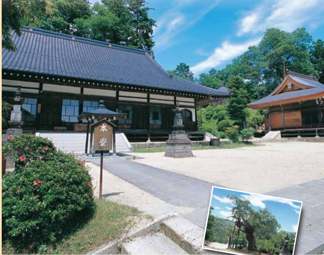
馬頭院とその境内にある三度栗

武茂城は、武茂氏の祖・泰宗が築城したと伝えられ、城跡の中腹には155段の石段がある静神社が鎮座しています。