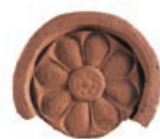
瓦・尾の草遺跡出土

昭和15年(1940)にこの地で発見された1本の銅印をきっかけに発掘調査が開始されました。当初は寺院跡と思われていましたが、広範囲にわたって役所や倉と見られる建物跡が確認されたことから国内最大規模の官衙(那須郡役所)跡であることが明らかになりました。奈良、平安時代の役所の様子を知る上で、大変貴重な遺跡として知られています。