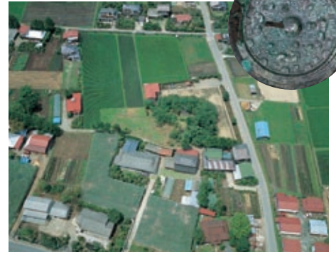
駒形大塚古墳/画文帯四獣鏡