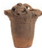
人面把手付土器・浄法寺縄文遺跡出土