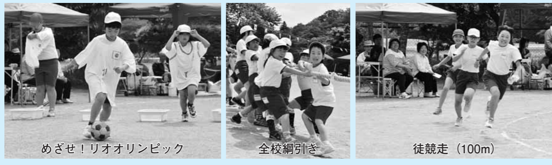
めざせ！リオオリンピック 全校綱引き 徒競走 (100m)