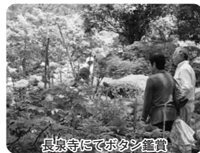
長泉寺にてボタン鑑賞