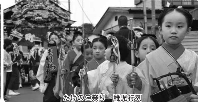
たけのこ祭り 稚児行列