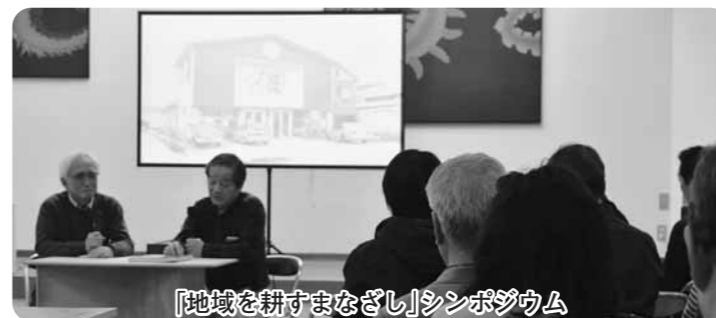
「地域を耕すまごし」シンポジウム

4月30日から5月7日まで、KEAT2016(キート2016:小砂環境芸術祭)が開催されました。KEATは、3年に一度の開催となるので、3年間の集大成を感じさせる作品の数々が展示されました。期間中だけでなく、開催にあたり行われたイベントのシンポジウムや、最終日のクロージングイベントにも町内外から多くの方が参加され、KEATへの注目度の高さを感じました。 会場のひとつとなった小砂コミュニティセンター内には、那珂川町と学官連携をしている、宇都宮メディア・アーツ専門学校の学生が描いた似顔絵が展示されていました。期間中、お母ちゃんCaféやワークショップも開催され、家族連れの姿も多く見られました。