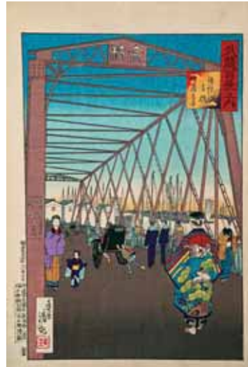
「武蔵百景之内 鉄砲洲高橋佃島遠景」 小林清親画

の男性の後ろ姿、その前には人力車、水兵の姿が見えます。橋の先には一本マストの弁財船が佃島に停泊しています。