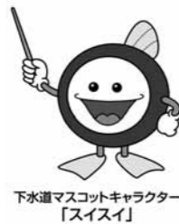
下水道マスコットキャラクター「スイスイ」