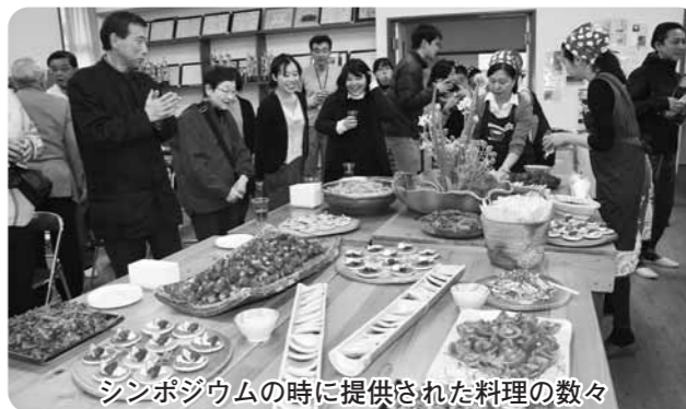
シンポジウムの時に提供された料理の数々