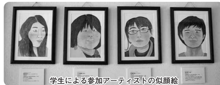
学生による参加アーティストの似顔絵