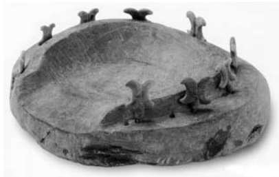
石枕 石神2号墳出土