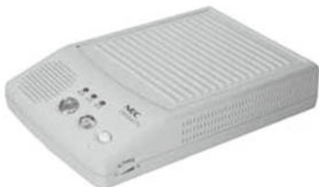
音声告知放送受信機

※平成22年4月1日以降の申し込みについては、加入金が40,000円、引込工事費が実費(負担限度額60,000円)となります。