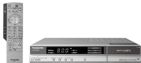
STB(セットトップボックス)