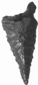
三輪仲町遺跡出土 つまみ付きナイフ（実物は鮮やかな濃赤です）