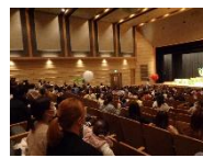
エレクトーン鑑賞会