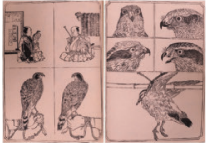
河鍋暁斎画「絵本鷹鏡」

版本のご紹介は今までしていなかったと思いますが、実は当館所蔵品の中には版本もかなりの数が含まれています。版本というのは、錦絵と同じように板木で絵や文字を印刷し冊子状にしたものです。当館で所蔵している版本のジャンルは多岐に渡りますが、なかでも多いのは歴史や物語、各地の名所を集めたもの、狂歌集などです。他には変化朝顔の逸品集など特徴的なものもありますが、「絵本鷹鏡」もほぼ全ページに鷹の姿が描かれている版本となっています。「絵本鷹鏡」は、鷹と共に野鳥などを狩る放鷹を主にテーマとしています。放鷹の起源や歴史は不明な点が多いようですが、5～6世紀頃には鷹匠の埴輪が出土するなどかなり前に普及していたのではと考えられています。江戸幕府成立後は、規制によって幕府の行事として放鷹が行われていたようです。「絵本鷹鏡」では、野山で雁やウズラ、鶴などを狩る様子を2ページにわたって描いたり、狂歌と共に鷹匠と鷹の姿を描いたりなど様々な時代の放鷹の様子が見る事ができます。なかでも注目すべき点は、今回ご紹介しているページのように鷹の顔をクローズアップさせたものや止まり木に留まる鷹を多くのページにわたって描いている点です。また、鷹に餌をやったり、羽を整えてあげたり、更に大鷹の雛を育てたりなど鷹匠たちの世話の様子も描かれています。