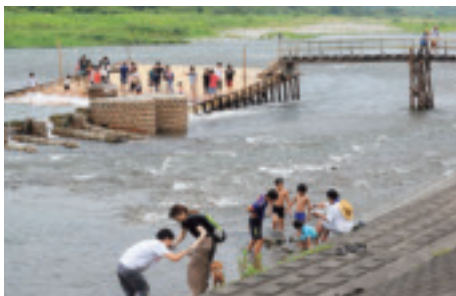
観光協会長賞「平成最後の夏休み」 撮影地：谷田