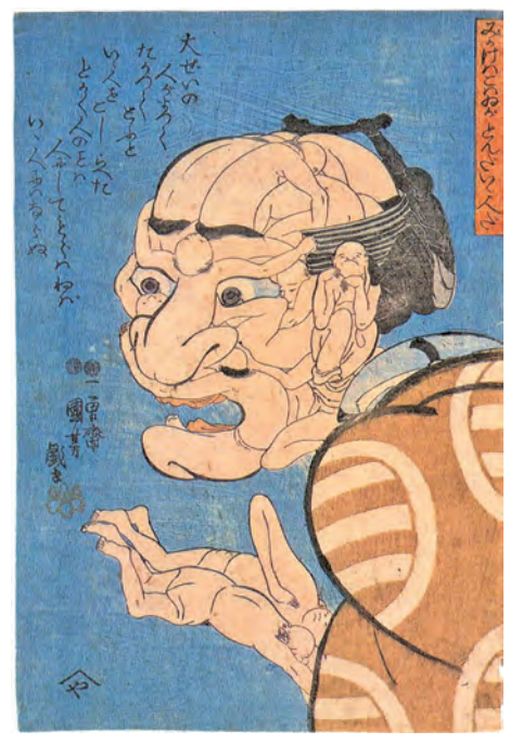
歌川国芳「みかけハこハるがとんだいゝ人だ」

今回の展覧会では、国芳の代表的な戯画「みかけハこハるがとんだいゝ人だ」をはじめ、古典を扱った「百人一首」、武者絵、美人画など多彩な分野の作品を紹