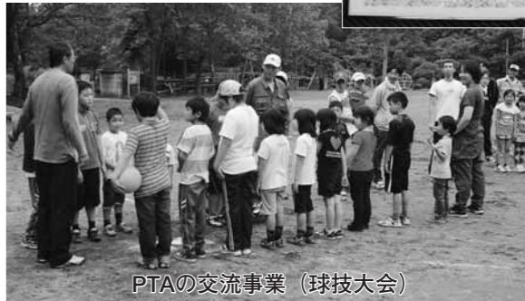
PTAの交流事業（球技大会）