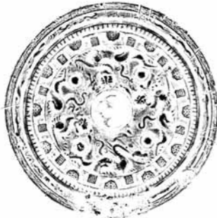
「画文帯四獣鏡 拓本」

那珂川町にも、龍の姿が描かれ、海を渡ってきたものがあります。小川地区にある駒形大塚古墳は4世紀半ばに造られた前方後方墳ですが、昭和49年の発掘調査で、ここから2世紀末から3世紀初めに中国で作られた画文帯四獣鏡という鏡が出土しました。鏡の背面には、右まわりの4頭の獣の姿が描かれ、1頭は龍、2頭は虎、1頭は龍か虎と考えられています。龍の体は虎と同じように描かれています。首は、長い首を持ち、首の後ろには三角に尖ったヒレかタテガミのようなものがついています。当時の鏡は顔を映す道具ではなく、所有者の力や地位を示すものでした。中国から輸入された中国鏡は貴重なもので、栃木県内からはこの鏡と、同じ町内の那須八幡塚古墳から見つかった夔鳳鏡と、2面しか見つかった。