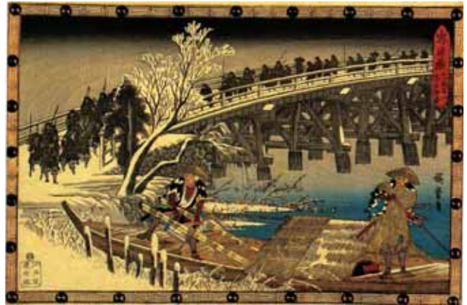
「忠臣蔵 十一段目一 夜打押寄」

元禄の太平の世を騒がせたこの仇討ちは寛延元年（1748）8月、大坂の竹本座で人形浄瑠璃「仮名手本忠臣蔵」の名で初めて上演されて人気を博し、後に歌舞伎や講談などにも取り上げられました。「忠臣蔵」の名称は造成語で「平仮名」の47文字と討ち入りした赤穂藩旧藩士の47人とを掛けているといわれています。図の「忠臣蔵 十一段目一 夜打押寄」は、いよいよ主君の敵の屋敷へ討入りに向かう義士たちを描いたものです。雪が降り積もった橋を整然と渡る姿は、討入り前の緊張感や静けさを感じさせます。