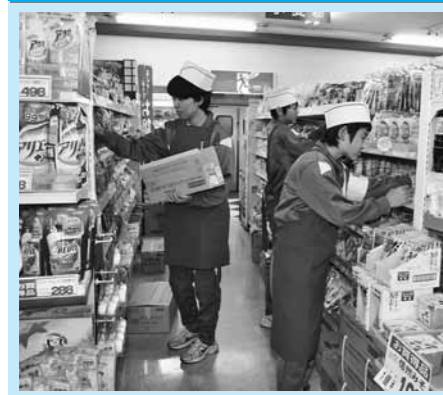
スーパーさかいり