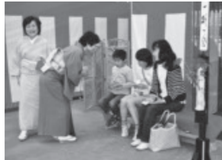
お抹茶接待(町文化協会 茶道部)