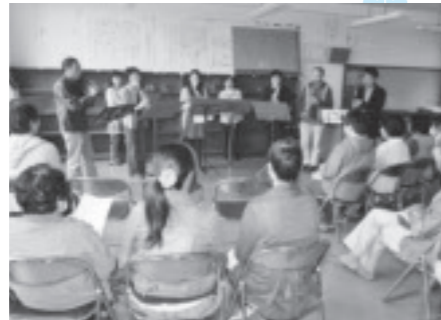
リコーダー・アンサンブル(小川リコーダー愛好会)