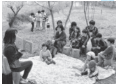
野原でおはなし会(たまごの会)