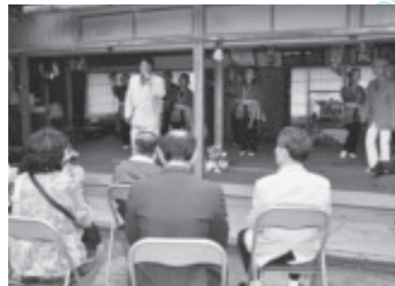
震災復興祈念イベント(鷺子山上神社)