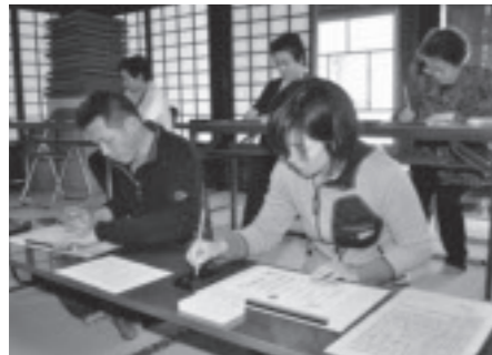
心静かに写経(馬頭院)