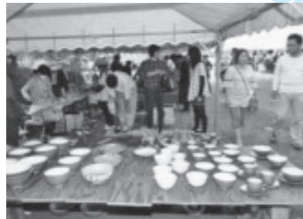
春の陶器市(小砂焼陶芸の里体験センター組合)