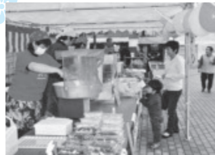
広重春まつり(馬頭商店街)(那珂川町商工会)