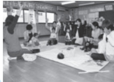
♪わくわく♪リトミック(ちびっこわーど)