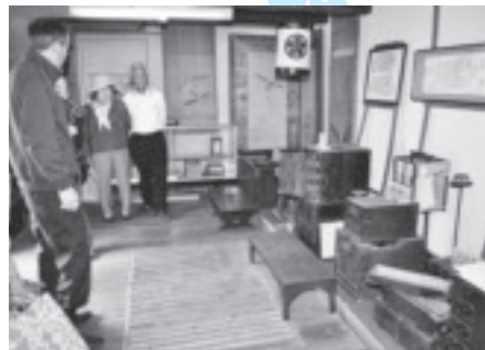
味噌蔵ギャラリー(金子商店)