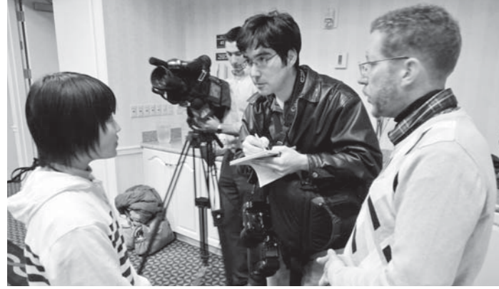
地元のテレビ局にインタビューされる