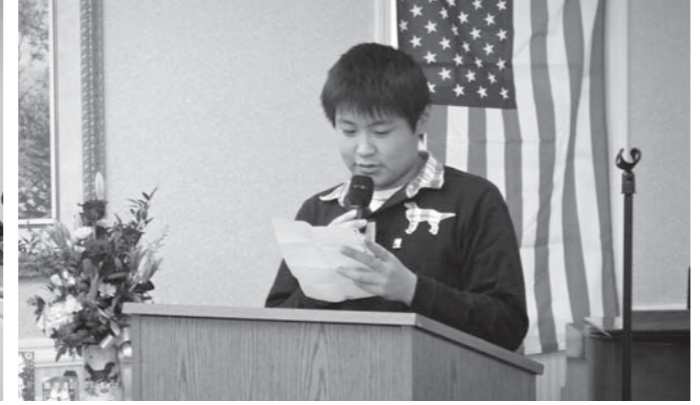
ウェルカムパーティーで英語スピーチ