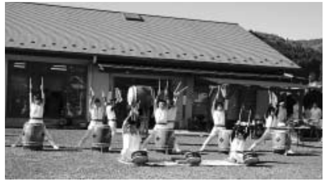
参加者の約6割が 東京近郊在住者