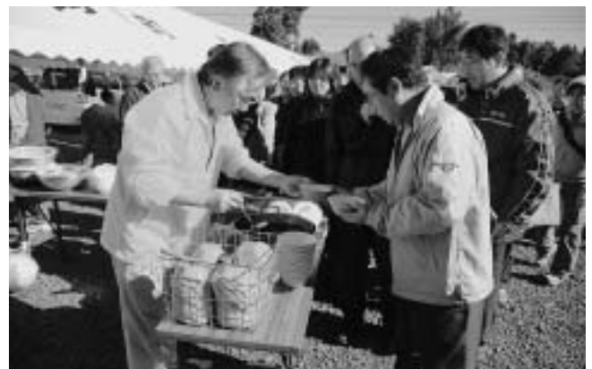
現地説明会で寄せられた 参加者からの質問Q&A