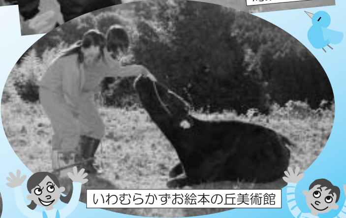
いわむらかずお絵本の丘美術館