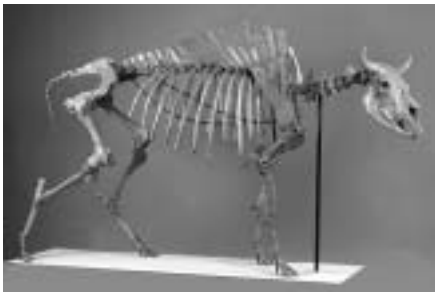
ハナイズミモリウシ復元模型 岩手県立博物館所蔵