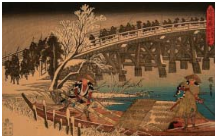
「忠臣蔵十一段目一 夜打押寄」 歌川広重

『仮名手本忠臣蔵』は、『義経千本桜』『菅原伝授手習鑑』と共に歌舞伎の3大名作のひとつといわれています。47士による討入りが物語のクライマックスですが、人形浄瑠璃としての初演は奇しくも赤穂事件から47年目のことでした。