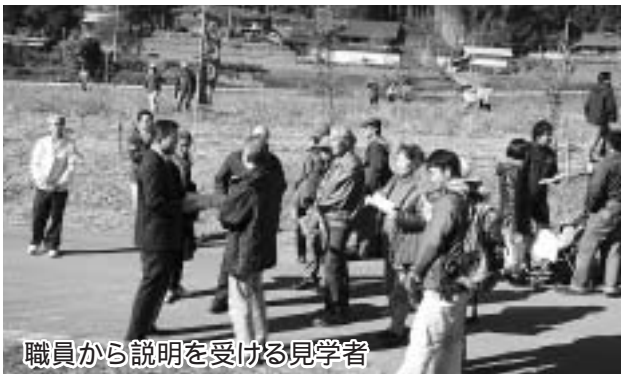
職員から説明を受ける見学者