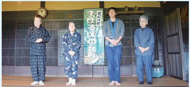
ふるさとの森公園にて