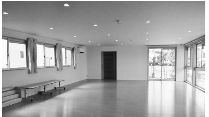
子育て支援センター（遊戯室）