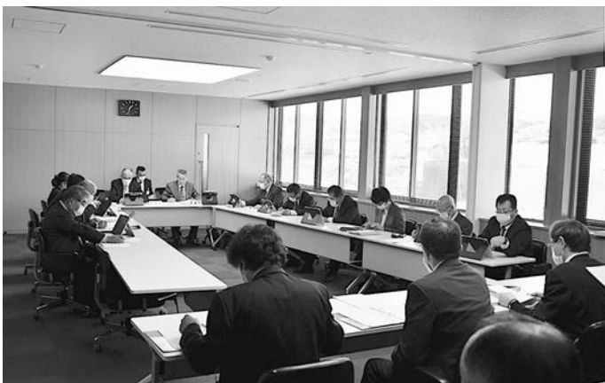
担当課から報告を受ける

常任委員会所管事務調査における意見書について、担当課からこれまでの経過等報告をいただきました。