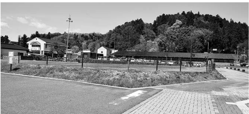
利活用が待たれる旧那珂川庁舎跡地

が課題となっている。面積要件引き下げを行うことにより課題の解決が図れることから、新規就農を目指す方や農ある暮らしを希望する方の移住定住が実現できるよう、農業委員会と連携し取り組んでいく。