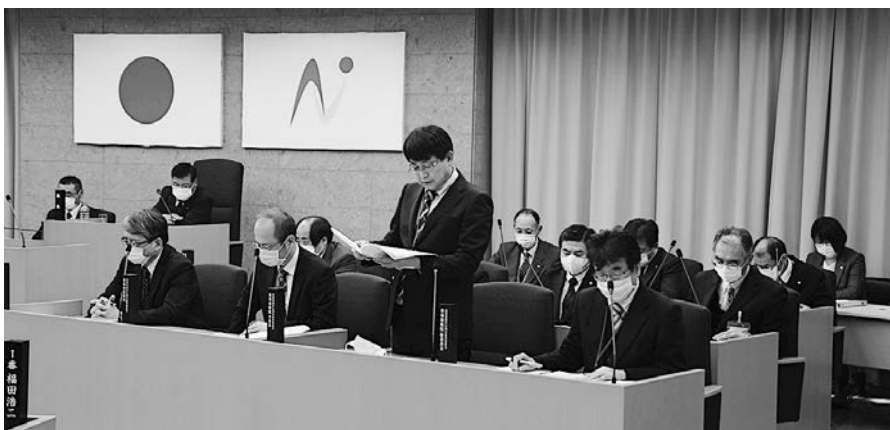
広域事務組合担当者（前列）から説明を受ける

また、保健衛生センターの整備については、新たなごみ処理施設、し尿処理施設を整備するために、平成30年3月に基本構想が策定され、平成30年7月に建設候補地選定委員会が設置されました。これまでの経過報告に続き、建設候補地が示されました。