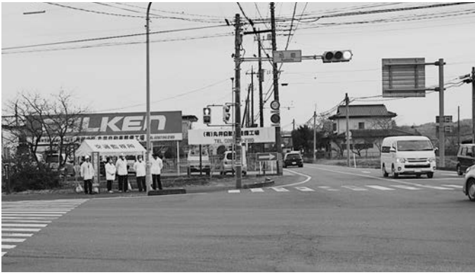
9日夕、教育民生常任委員が交通監視に協力

4月6日から15日までの春の交通安全総ぐるみ運動で、4月9日の朝夕の2回、旭町交差点で、常任委員会ごとに交通監視に立ちました。 朝7時30分から、総務産業常任委員7名、夕方4時30分から教育民生常任委員5名がそれぞれ立ち、交通安全を呼びかけました。