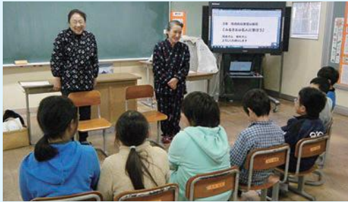
馬頭東小学校での様子

A お話しているうちに、身を乗り出して聞いてくれた時かな。心が通い合えたと感じ、本当に嬉しくなるわ。