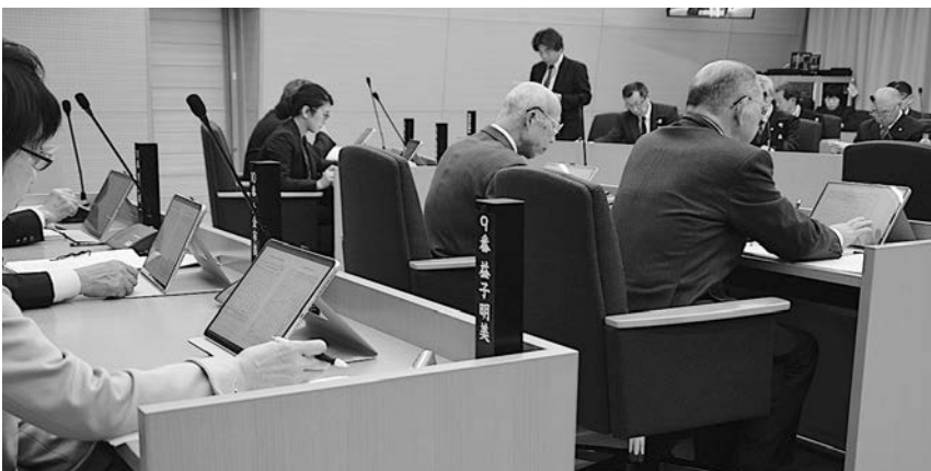
タブレットを使用した会議